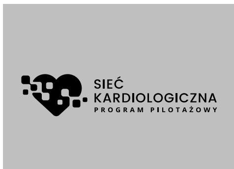
Wersja achromatyczna czarna i biała